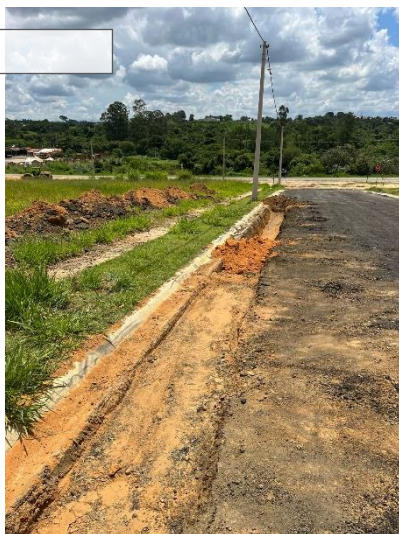
LOTEAMENTO JARDIM DAS ACÍCIAS