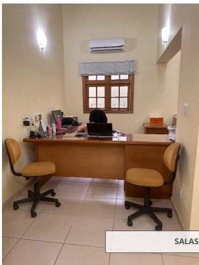
SALAS DE TRABALHO