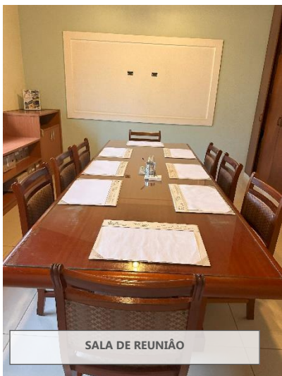
SALA DE REUNIÃO